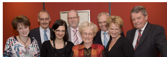
Anno Domini 2010.

Het jaar 2010 kan met recht een roerig politiek jaar genoemd worden. In de aanloop naar de gemeenteraadsverkiezingen sneuvelde de landelijke regering in de laatste week van februari. De uitslag van de gemeenteraadsverkiezingen in maart liet zien dat er een en ander zou veranderen in het politieke landschap. De ChristenUnie boekte in Fryslân zetelwinst, maar moest een licht stemmenverlies incasseren. De landelijke verkiezingen in mei vertoonden ook in Fryslân een 'ruk naar rechts'. In hoeverre dat het geval zal zijn met de verkiezing van Provinciale Staten op D.V. 2 maart 2011 is ongewis. In ieder geval is er veel gebeurd in het afgelopen jaar. In vogelvlucht nemen we u in deze nieuwsbrief het jaar mee door.